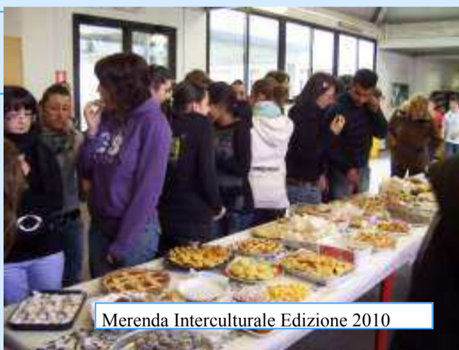
Merendona Interculturale Edizione 2010