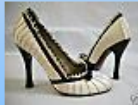
Scarpa Louis Vuitton