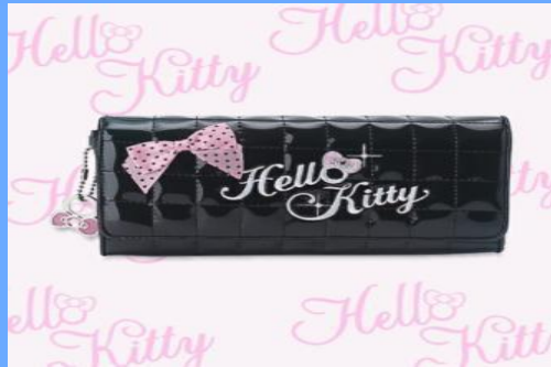
Portafoglio Hello Kitty